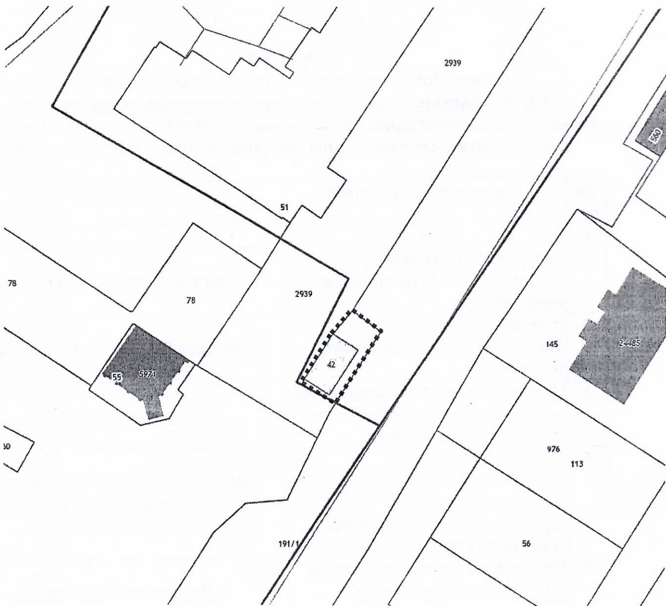
Схема границ территории планирования